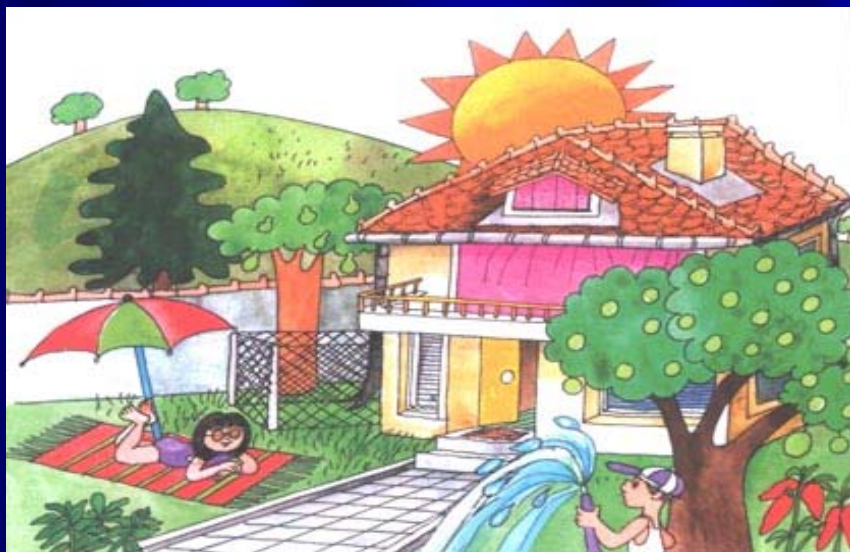
Роден край, Просвета, с. 52