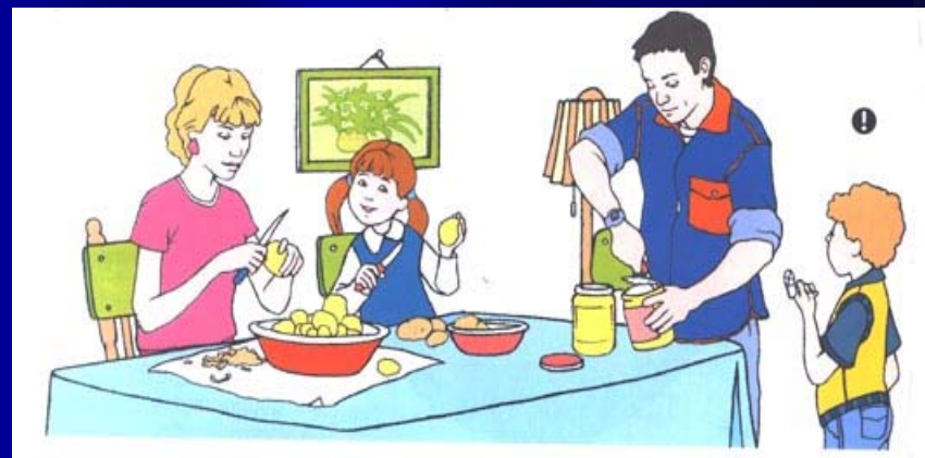
Роден край, Булвест 2000, с. 16