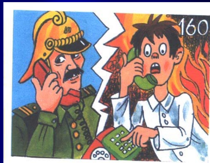
Домашен бит и техника, Просвета, с. 25