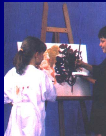
Изобразително изкуство, Просвета, с.23